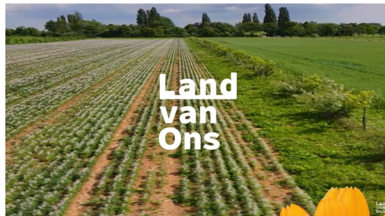
Land van Ons

https://www.youtube.com/watch?v=Ug81UesxTqg